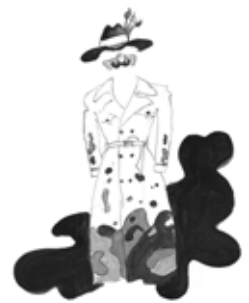
Espenrenzo Gooble III