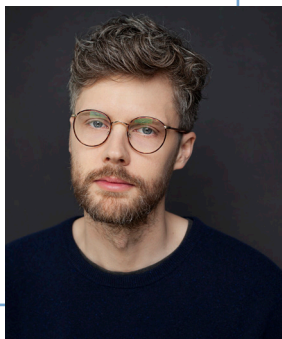
Philippe Cyr CRÉATION