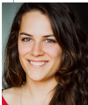
Odile Gamache SCÉNOGRAPHIE