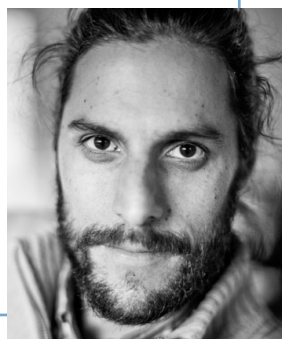
Gaëtan Nerincx CAMÉRA