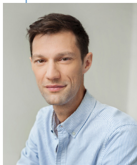
Gilles Poulin-Denis CRÉATION