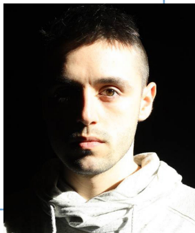
Cédric Delorme-Bouchard ÉCLAIRAGES