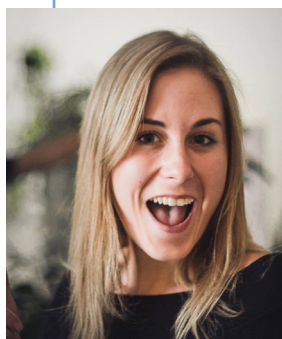
Patricia Derome CAMÉRA