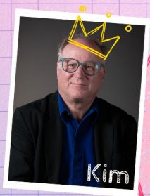
Most likely to retire in 2025

A Funny Fundraiser (Une drôle de collecte de fonds pour PHT, en anglais)