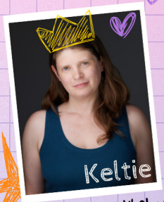
Most likely to become Artistic Director